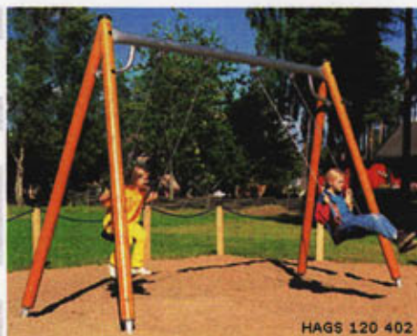
HAGS 120 402