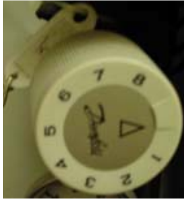
v.nr.5 hele gulvflaten 1.etg.