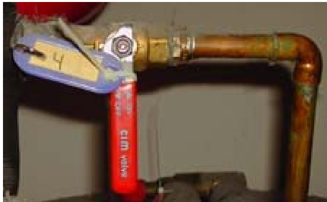
V.nr.4 Etterfylling eksp.kar 2 BAR