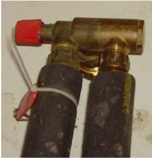
v.nr.2 blandeventil varmtvann