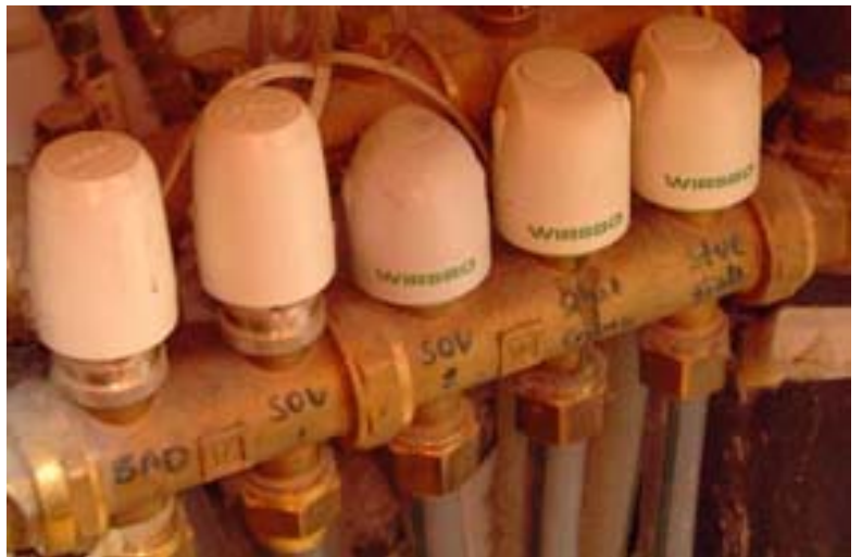
Tresostater/varmefordeler gulvvarme (gjelder 1.etg.)