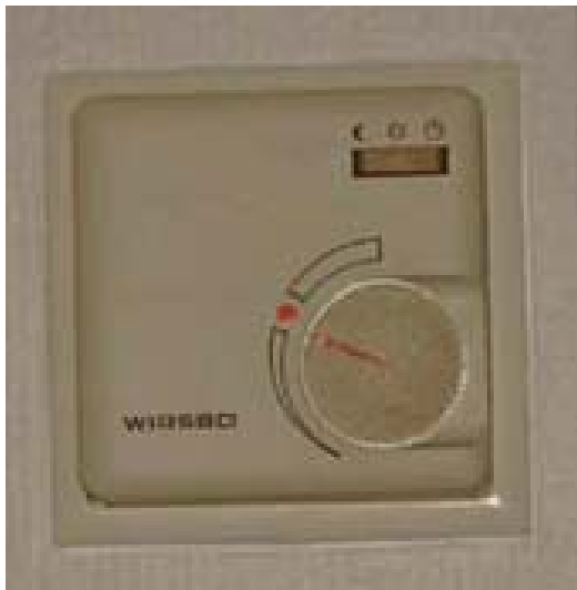
Romføler/termostat (gjelder 1.etg.)