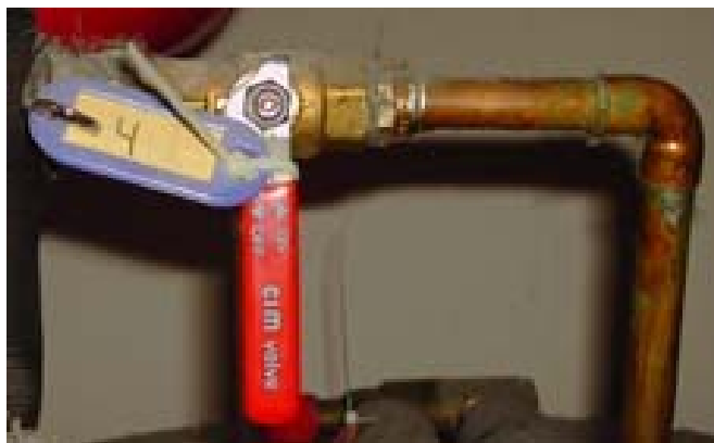
V.nr.4 Etterfylling eksp.kar 2 BAR